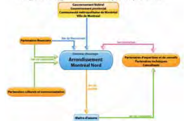
Un exemple d'outil utilisé dans la stratégie de gestion du projet- Diagramme organisationnel des parties prenantes