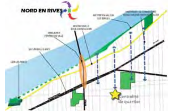
La représentation graphique des informations- Carte synthèse des différentes orientations