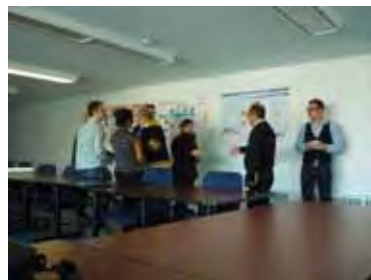
La rencontre du 14 avril à l'arrondissement de Montréal-Nord

Dans le cadre de l'atelier de gestion de projets, il a été remis à l'équipe le mandat d'analyser les besoins et les potentiels du site de la MAISON BRIGNON DIT LAPIERRE et de proposer un programme d'aménagement. L'objectif est de fournir à l'arrondissement de Montréal-Nord, un GUIDE proposant une démarche à suivre dans le MONTAGE ET LA GESTION d'un tel projet afin d'en assurer son succès.