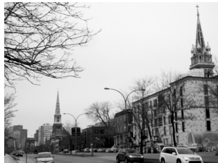
Les églises Saint-Pierre-Apôtre et Sainte-Brigide de Kildare

Les églises de Montréal sont en grand nombre et ont donc une FORTE CONCENTRATION sur le territoire. Leur fonction est désuète, mais elles renferment une partie importante de l'histoire du Québec et elles ont fait grandement partie de la vie de la majorité des Québécois. La forte présence de l'Église a même visiblement modifié le territoire québécois par les nombreux clochers qui le sillonnent. La démolition de ces bâtiments voudrait dire la perte d'un héritage et d'une partie de l'histoire du Québec.