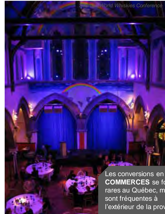
Le manoir Oran Mor, Glasgow

Les conversions en COMMERCES se font rares au Québec, mais sont fréquentes à l'extérieur de la province.