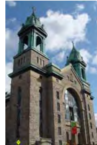
L'ancienne église Saint-Jean de la Croix, aujourd'hui des condos

Pour faciliter la prise de décisions lors des choix de conservations et de conversions d'églises, une GRILLE DE CONVERSION est établie et énumère les différents points à étudier. Dans un premier temps, les ASPECTS PHYSIQUES, PATRIMONIAUX ET IDENTITAIRES sont étudiés. Dans un second temps, le MILIEU dans lequel l'église se trouve est étudié pour permettre un bon choix de conversion et ainsi une meilleure intégration de la nouvelle église convertie.