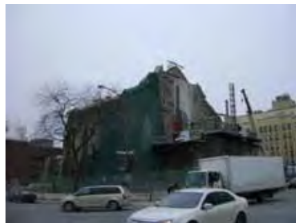
Démolition de l'église Saint-Sauveur

L'église a cette particularité d'être publique et communautaire tout en appartenant à ses paroissiens. Si sa fonction doit changer, l'option qu'elle demeure OUVERTE AU PUBLIC est celle le mieux en vue pour une conversion éventuelle. Par contre, il n'est pas toujours possible de redonner ces grands bâtiments à la population sans en payer le prix. Le désir de sauver toutes les églises est UTOPIQUE . Des conversions vers le milieu privé doivent être envisagées pour permettre aux autres d'être conservées.