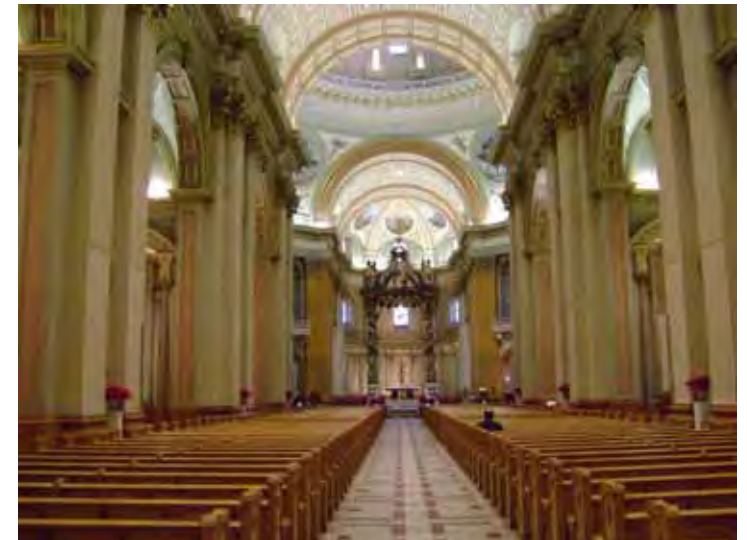
Nef de la cathédrale Marie Reine-du-Monde

Il est toujours plus simple et moins coûteux de convertir une petite église, mais les églises catholiques de Montréal sont généralement de GRANDE TAILLE et rendent l'idée d'une conversion difficile à concevoir. Leurs COÛTS D'ENTRETIEN SONT TRÈS ÉLEVÉS et créer une rentabilité avec ces vieux bâtiments est complexe. Des restrictions sont établies concernant la PATRIMONIALITÉ des lieux et du bâtiment. La conservation de l'intérieur est souvent impossible mais l'extérieur doit demeurer le même. L'image que donne l'église sur son quartier ne doit pas être altérée.