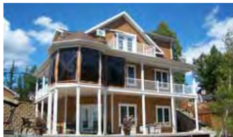
Résidence permanente aux abords de la Rivière-aux-Pins

En second lieu, il est intéressant de s'attarder aux avantages et aux inconvénients de vivre dans un tel milieu.