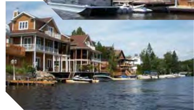
L'accès aux embarcations nautiques est simple pour les riverains de la Rivière-aux-Pins