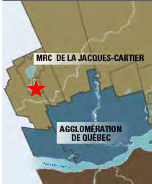
★ Ville de Fossambault-sur-le-Lac

Le domaine de la Rivière-aux-Pins est aux abords du LAC SAINT-JOSEPH et au cœur d'un milieu de VILLÉGIATURE . Ainsi, on peut y pratiquer plusieurs activités nautiques et de plein air.