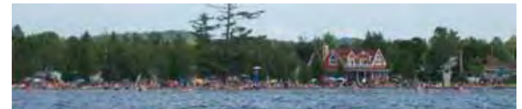
Plage du Domaine de la Rivière-aux-Pins

En somme, le Domaine de la Rivière-aux-Pins est un lieu d'habitat attrayant notamment en raison des activités et des loisirs offerts à proximité de l'habitat. De plus, la densité des résidences et le caractère privé du Domaine donnent naissance à un milieu social et un mode de vie particuliers et très appréciés des habitants.