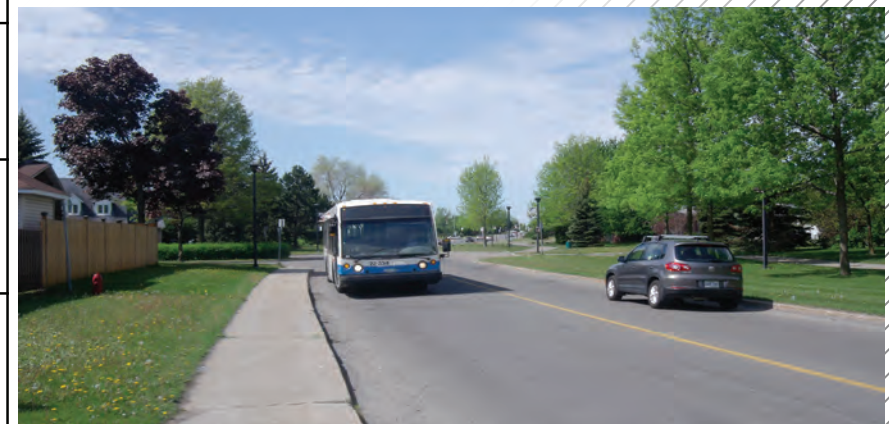
Deux lignes d'autobus desservent l'île ; une se rend au centre commercial Fairview Pointe-Claire et l'autre à la gare Pierrefonds-Roxboro.