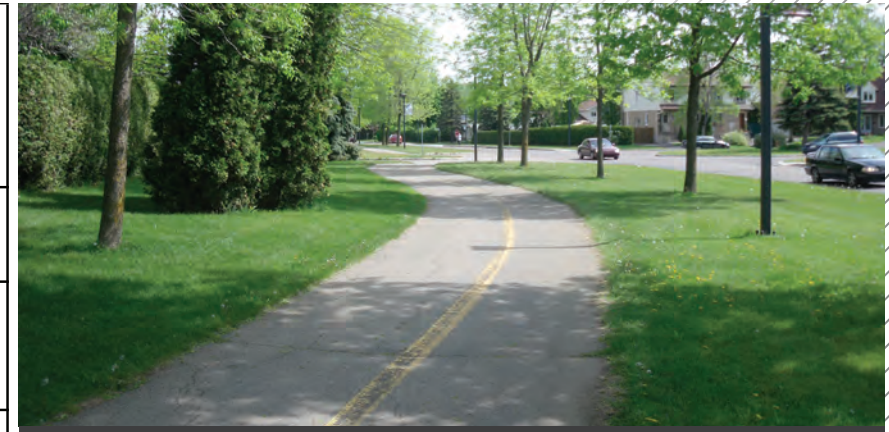
L'Île-Bizard bénéficie d'un réseau cyclable de plus de 16 kilomètres.

Une population beaucoup plus jeune à l'Île-Bizard qu'à la Ville de Montréal en 2006.