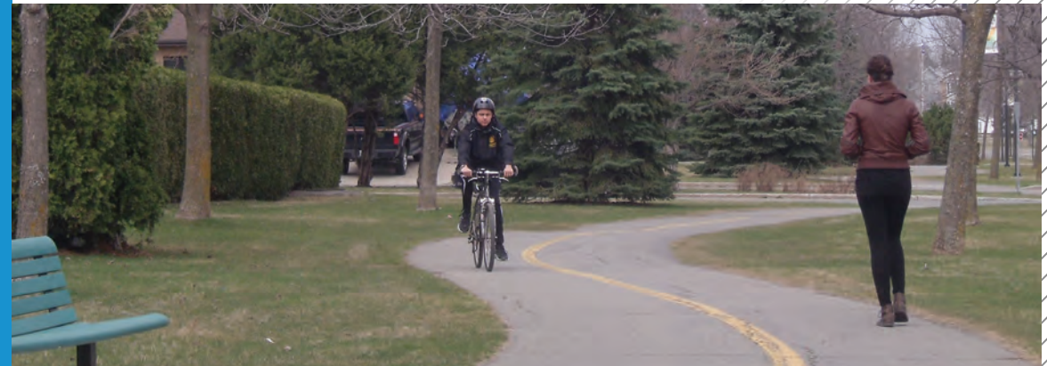
Le transport actif est souvent adopté par les résidents de l'Île-Bizard pour les déplacements à l'intérieur du territoire.