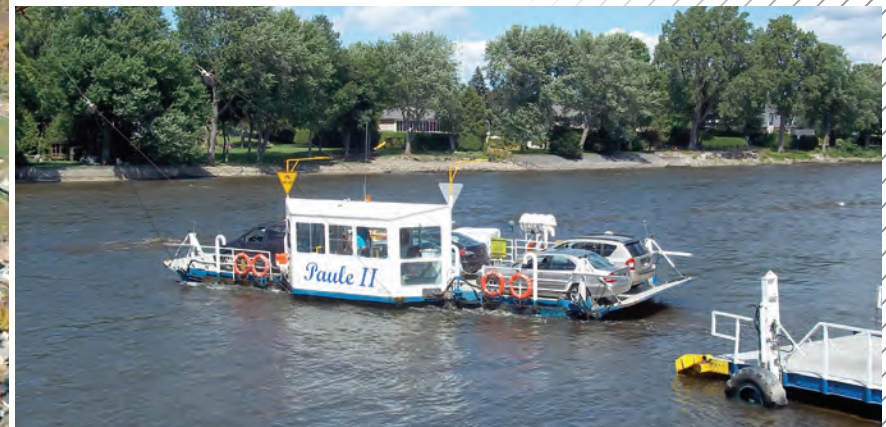
Le traversier Île-Bizard - Laval-sur-le-Lac situé au nord-est du territoire permet de rejoindre la Ville de Laval.