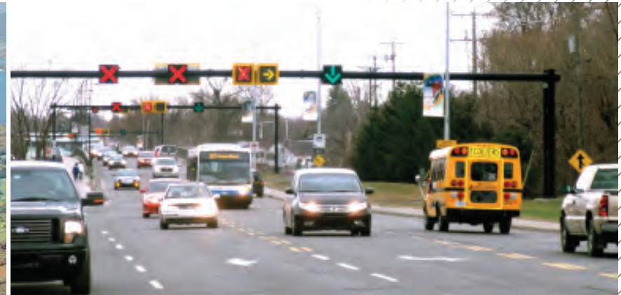
Le pont Jacques-Bizard situé au sud-est du territoire doit absorber quotidiennement un flux considérable de circulation routière.