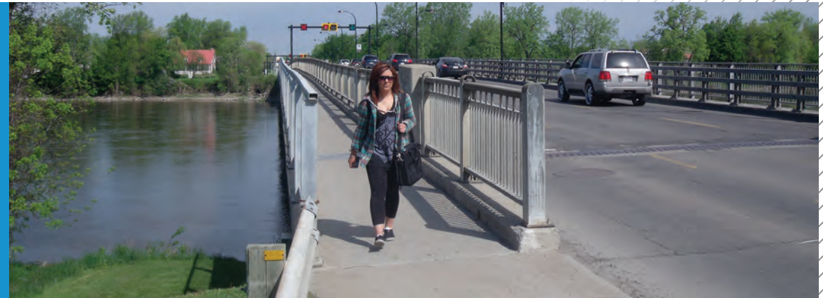
De nombreux étudiants traversent quotidiennement le pont Jacques-Bizard à pied ou à vélo.

• Une meilleure coordination avec les autobus de l'ouest de l'île de Montréal.