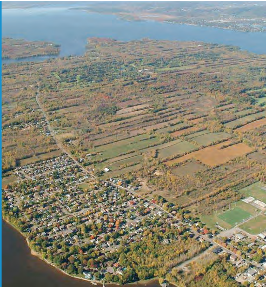
L'Île-Bizard comporte de nombreux espaces verts et cultivés.

Seuls le pont Jacques-Bizard et le traversier permettent de rejoindre les secteurs voisins. Ce traversier peut s'avérer une bonne alternative par rapport à l'usage de l'automobile pour le territoire de l'Île-Bizard puisqu'il est à moins d'un kilomètre de la gare de train de banlieue Sainte-Dorothée.