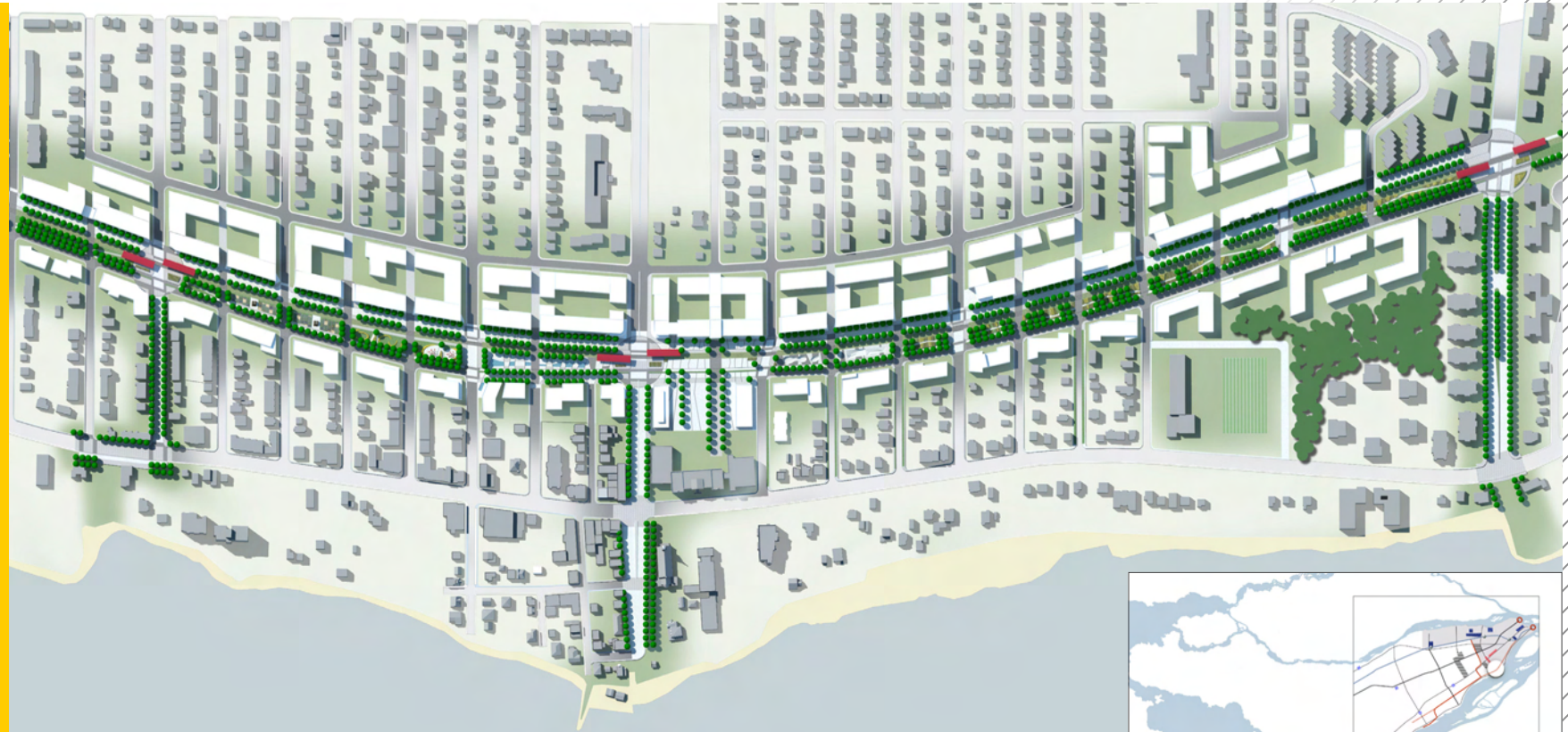
Plan de concept - réaménagement proposé de l'emprise et de ses abords, Vieux Pointe-aux-Trembles, Montréal