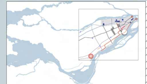
Contexte de localisation et plan clé