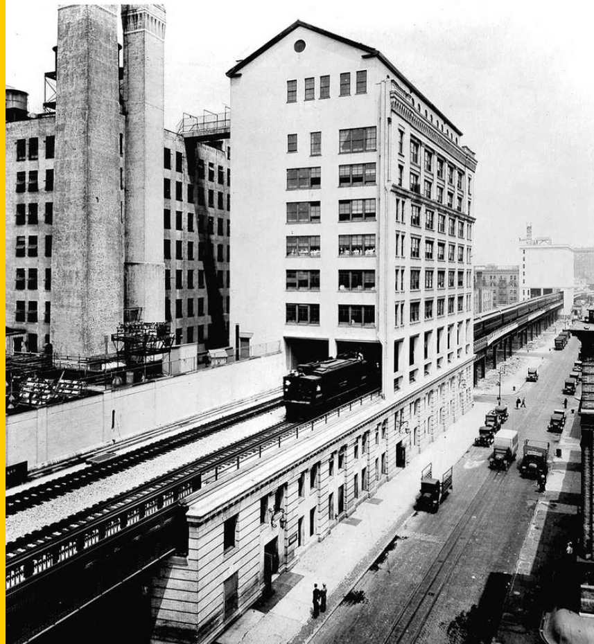
Photo historique de la New York High Line ( www.thehighline.org , février 2011)

À ces types de réutilisation sont associées des interventions qui se distinguent par le degré de réversibilité des réaménagements.