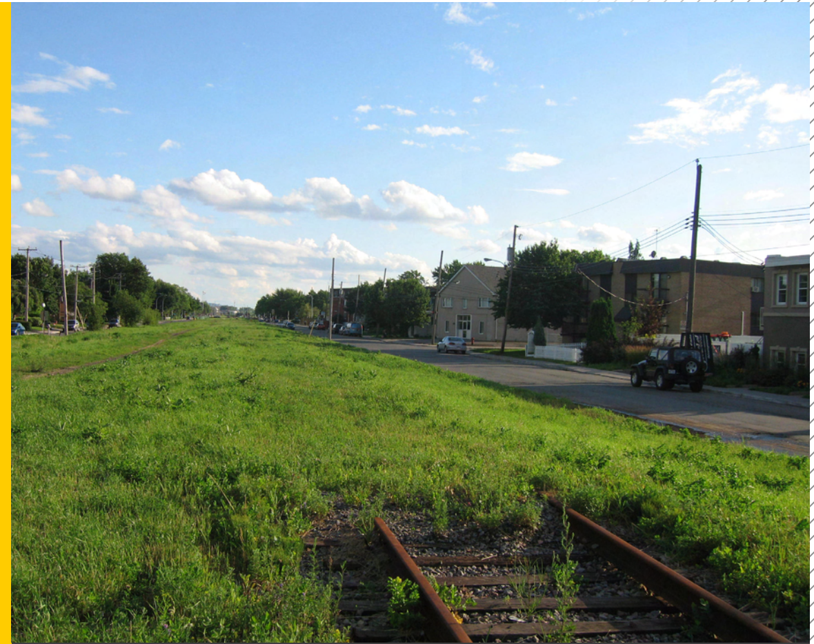
Emprise ferroviaire abandonnée (CN) - Vieux Pointe-aux-Trembles, Montréal