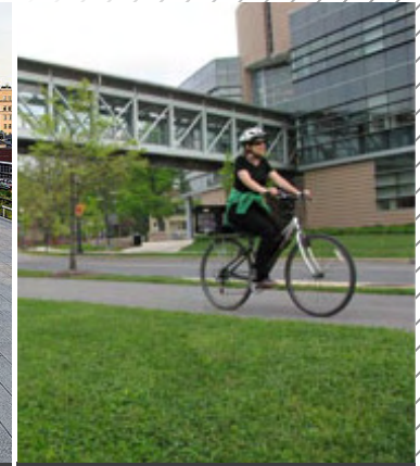
Metropolitan Branch Trail ( www.metbranchtrail.com , février 2011)