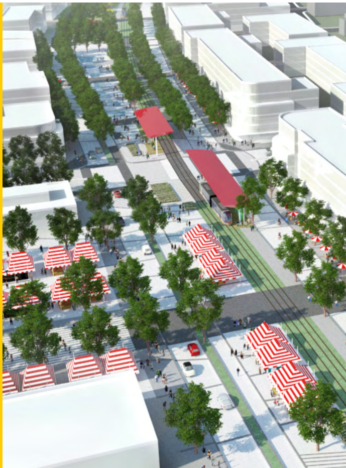
La Place du Marché - porte d'entrée au coeur du noyau villageois