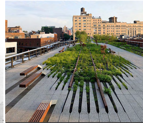
Réutilisation de la New York High Line ( www.thehighline.org , février 2011)