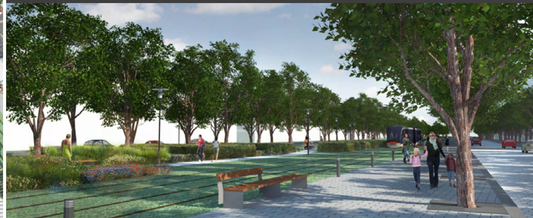
La promenade plantée