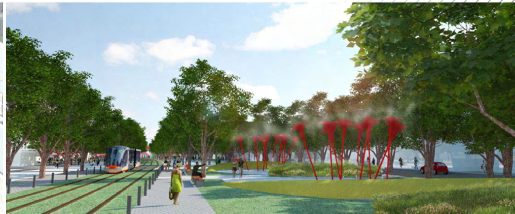
La Place du Ruisseau et jeux d'eau