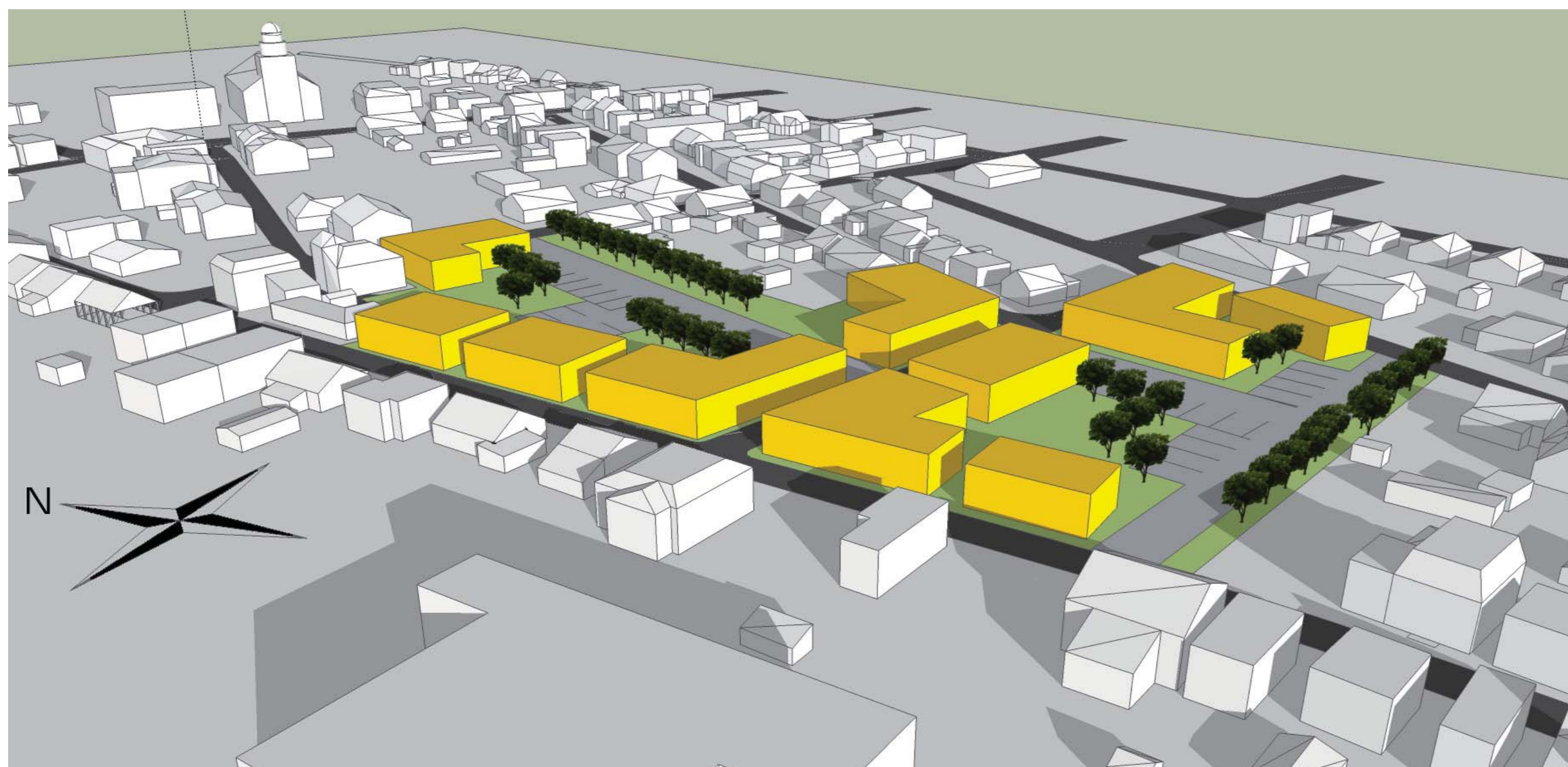
Modélisation de l'aménagement proposé pour le site R et LF

Il faut considérer toutes les caractéristiques morphologiques du tissu environnant afin de faire en sorte que l'aménagement s'intègre harmonieusement avec son entourage. Les outils de mise en valeur, tels le PIIA, les études de caractérisations ou le PPU de 1994, servent à élaborer un aménagement adéquat.