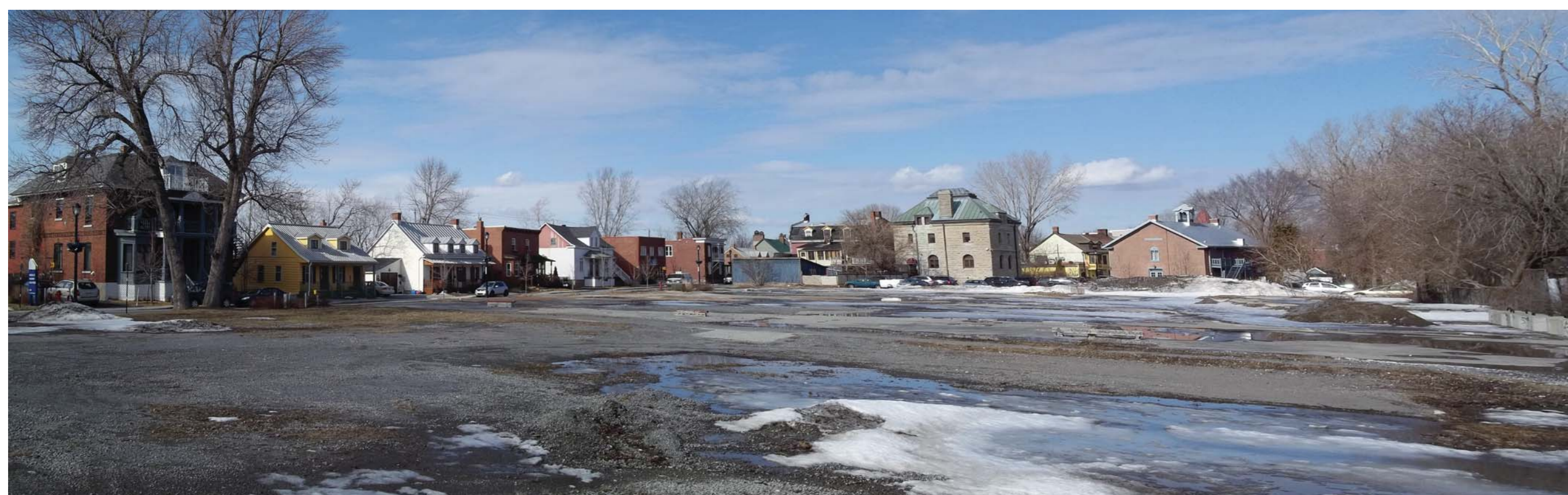
Vue panoramique sur le site actuel Rose et Laflamme

Le site de Rose et Laflamme accueillait jusqu'en 2002, les installations d'une industrie alimentaire. Lors de la démolition de ces installations, l'industrie Rose et Laflamme occupait l'entièreté du site à l'étude. Cette occupation est le résultat d'ajouts successifs au cours du 20e siècle. Progressivement, la compagnie a fait l'acquisition de tous les lots sur le site afin d'y implanter un seul immense bâtiment qui engloberait toutes leurs opérations. En conséquence, l'emprise de la rue Saint-Louis, qui traversait le site d'Ouest en Est, a été fermée. Suite au déménagement de l'entreprise, la ville devient propriétaire et procéda à la démolition. Le site Rose et Laflamme constitue maintenant un espace libre de toute construction. Par contre, plusieurs éléments sont à prendre en compte lors de l'élaboration d'un projet de réaménagement. Ce projet a pour but de faire une analyse autant du territoire que des outils de mise en valeur patrimoniale déjà en place afin de faire des recommandations concernant l'aménagement du site de Rose et Laflamme.