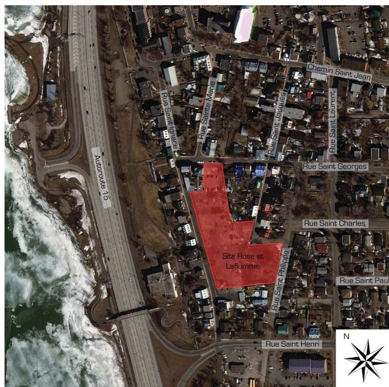
Localisation du site R et LF dans l'arrondissement

Depuis 1975, le bourg de La Prairie, sur la Rive-Sud de Montréal, est considéré comme un arrondissement historique selon la loi sur les Biens Culturels.