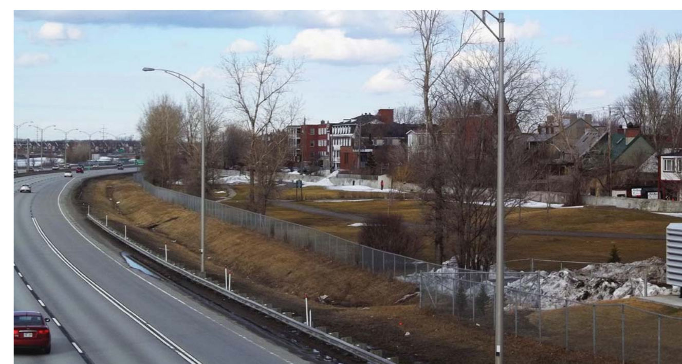
Parc des remparts coupé de la rive par l'A15

faisant en sorte qu'ils donnent directement sur la voie publique, créant un encadrement serré dans l'espace public. L'implantation de l'autoroute 15 sur la rive du bassin de La Prairie représente une nuisance importante pour le bourg. Elle fait en sorte que le bourg sera coupé de son accès au fleuve. De plus, l'autoroute est une source de pollution sonore et visuelle importante.