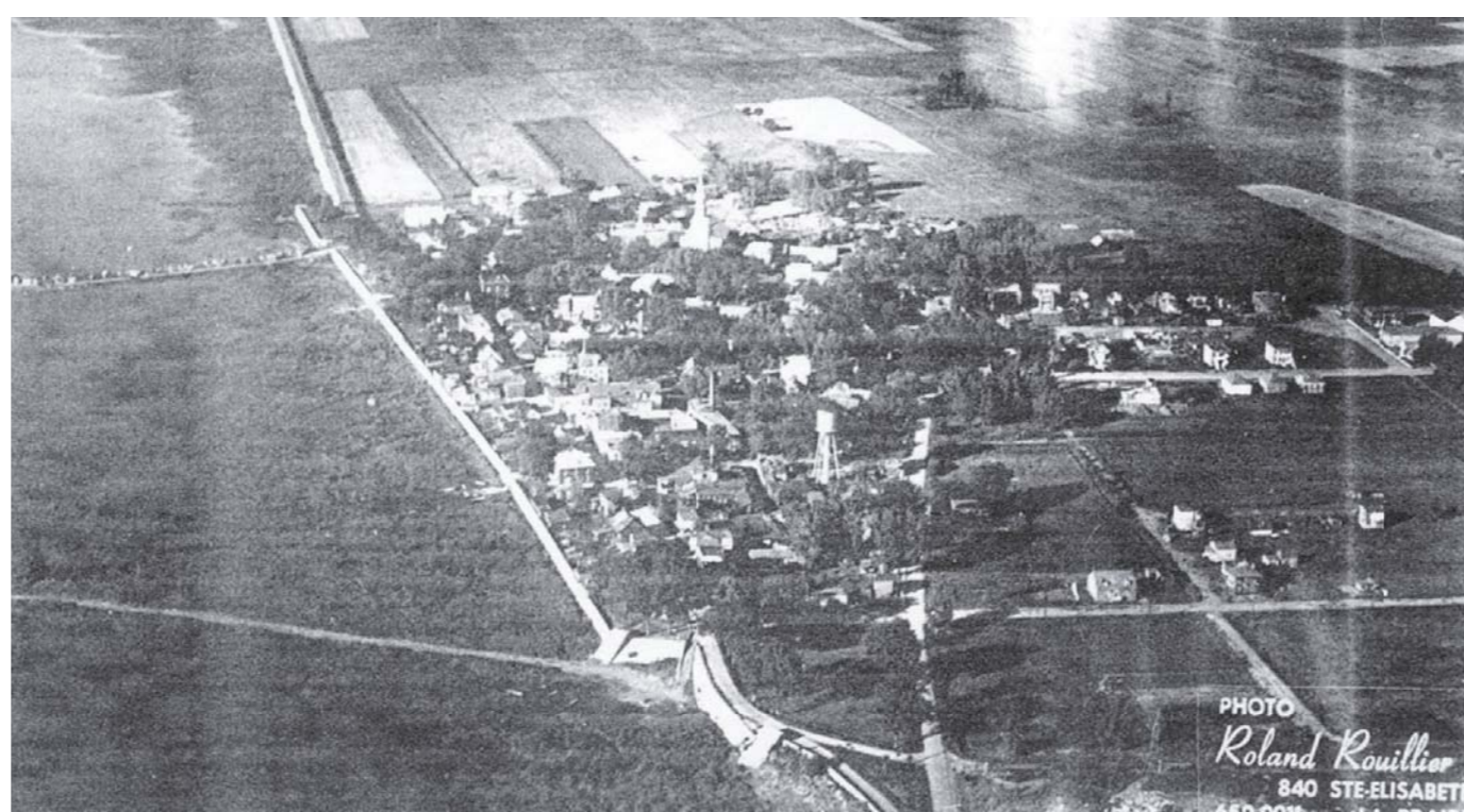
Vue aérienne sur le village de La Prairie en 1950

Historiquement, le village de La Prairie a joué un grand rôle dans le réseau de communication entre Montréal et la région de New York, La Prairie agit en tant que tête de pont pour le premier chemin de fer au Canada qui reliait le bourg au village de Saint-Jean-sur-Richelieu. Ce lien a permis au village de se développer autour d'une économie autre que l'agriculture. Lorsque le chemin de fer est détourné au profit de Saint-Lambert en 1851, le village de La Prairie voit l'apparition de plusieurs complexes industriels sur son territoire.