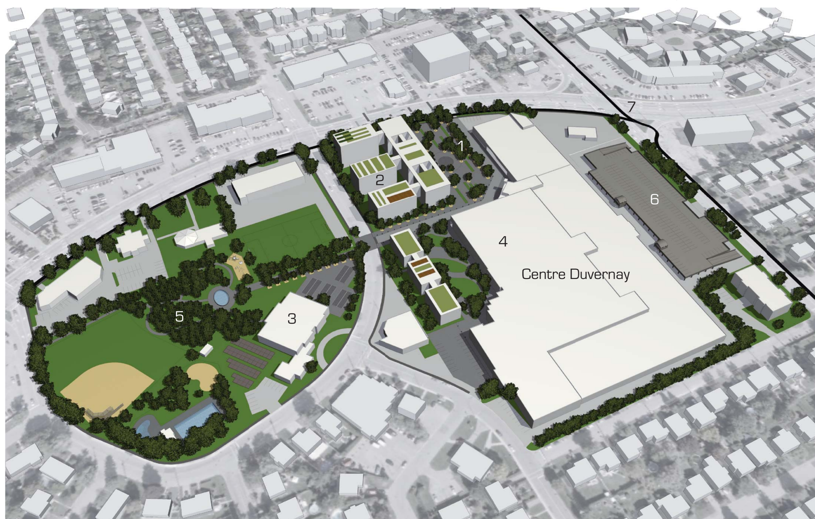
Vue d'ensemble du projet: un nouveau coeur pour le quartier