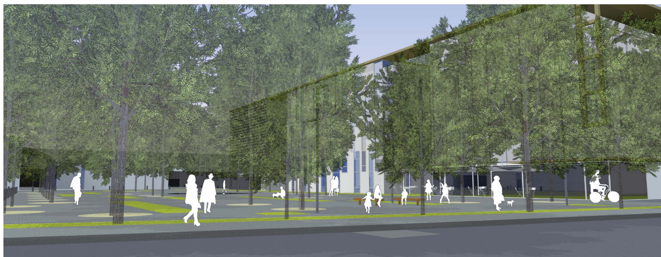
Perspective du boulevard Concorde: une esplanade encadrée

Le projet vise ainsi le maintien des anciens résidents du quartier dans leur environnement quotidien, évitant le déracinement de personnes âgées et animant ainsi un espace qui possède le potentiel de devenir un véritable noyau d'activités, un espace de vie.