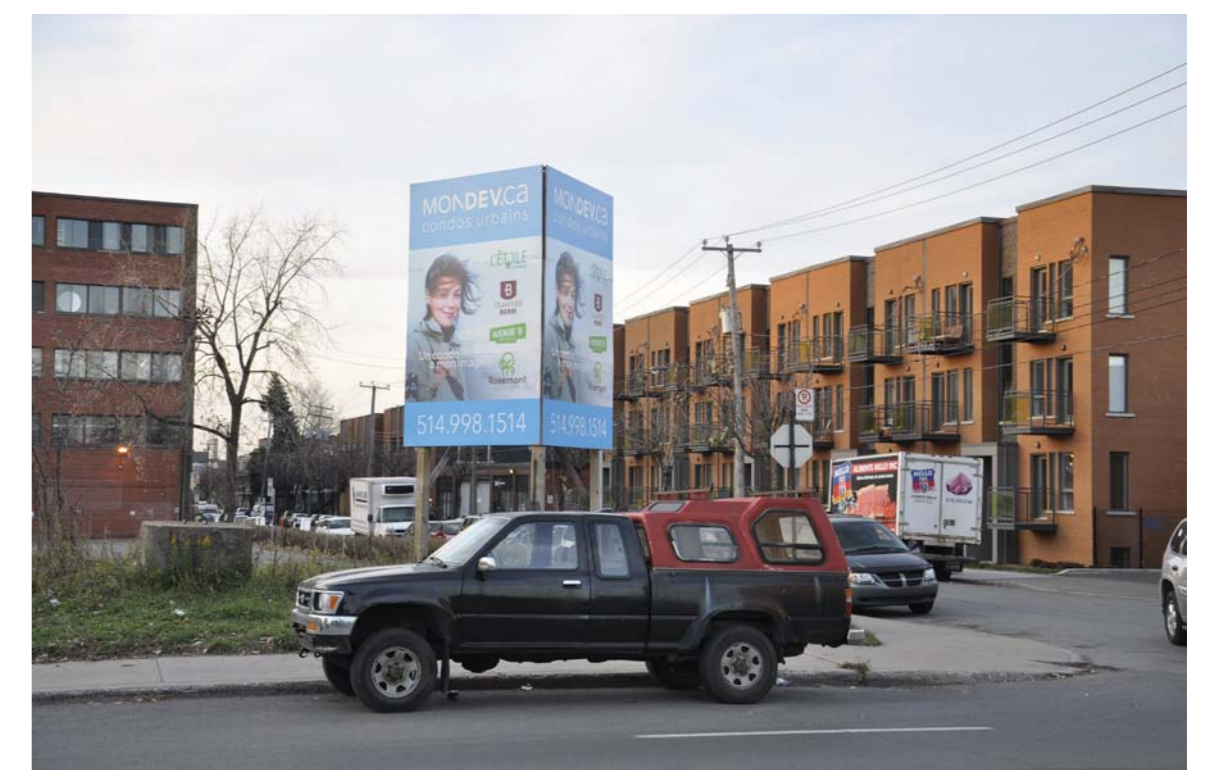
Des condominiums font leur apparition