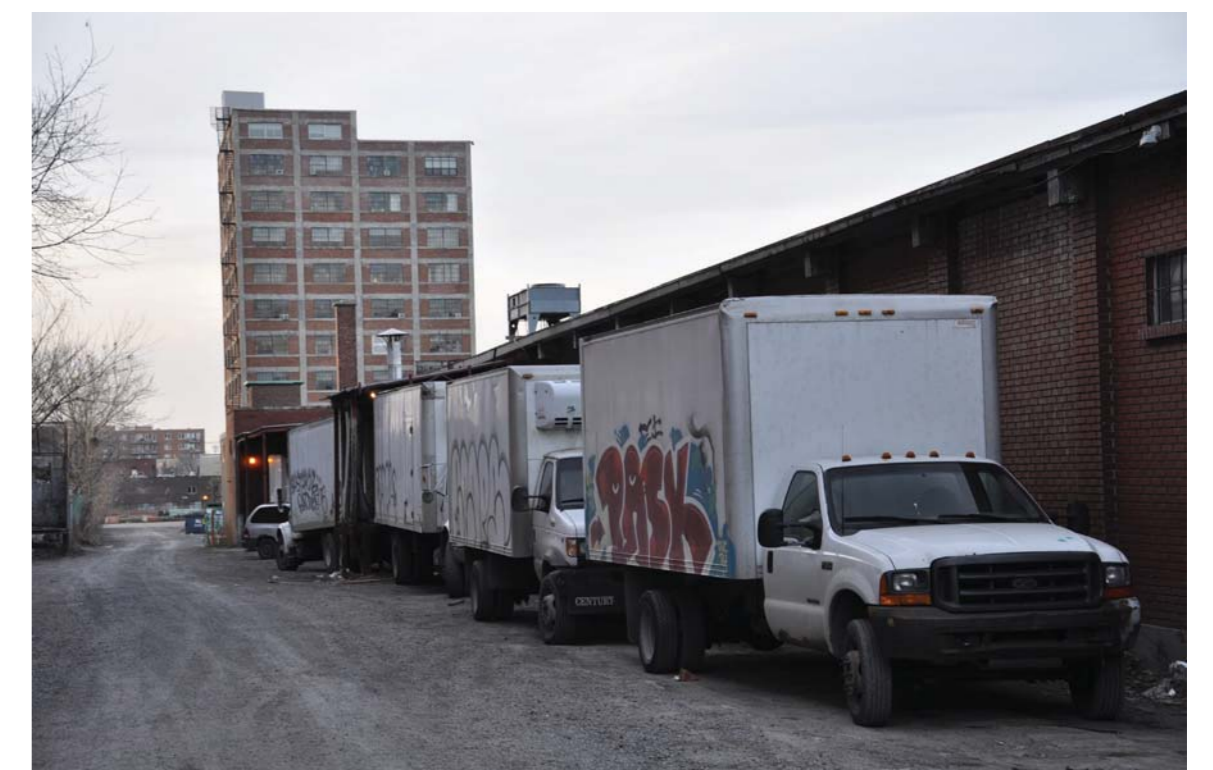
Les activités industriels entraînent bruit et camionnage