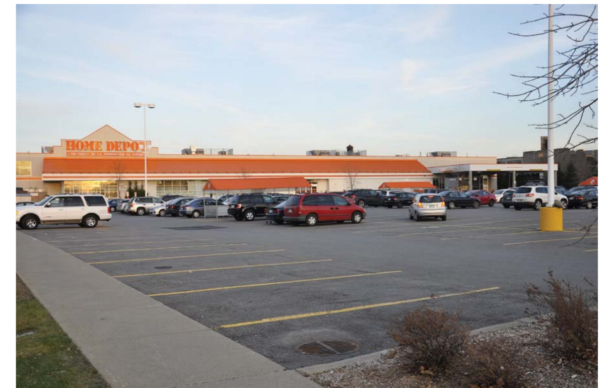
D'immenses espaces de stationnement sont sous-utilisés