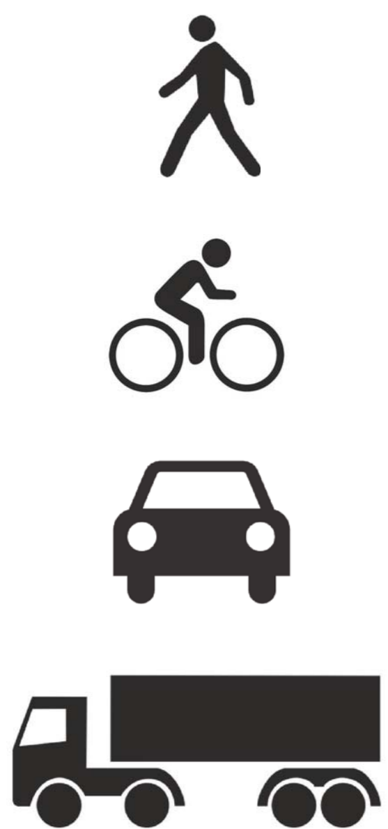
Concilier les différents modes de déplacement dans le secteur