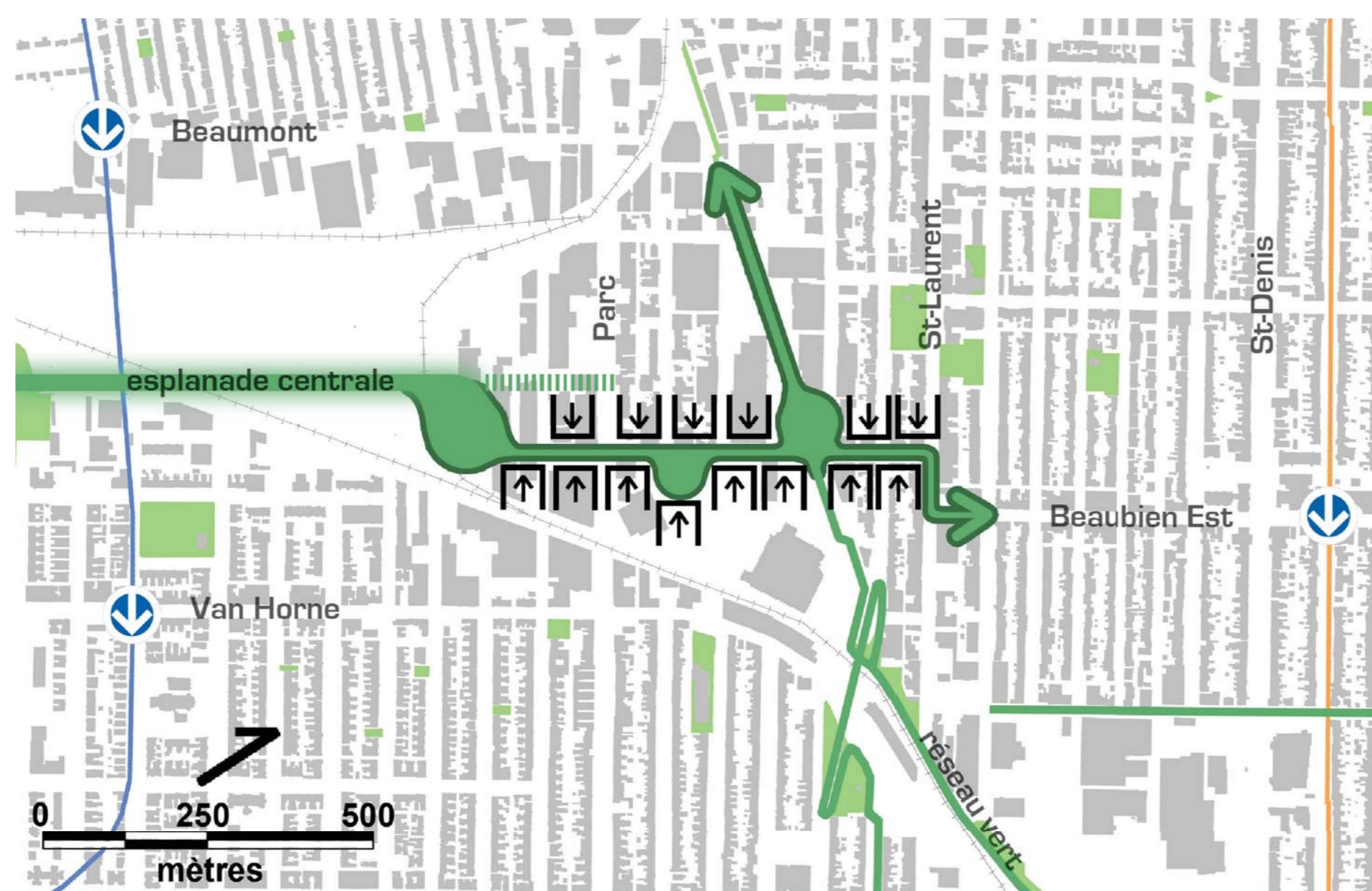
La rue Beaubien Ouest comme porte d'entrée autant pour le campus Outremont que pour le quartier de La Petite-Patrie