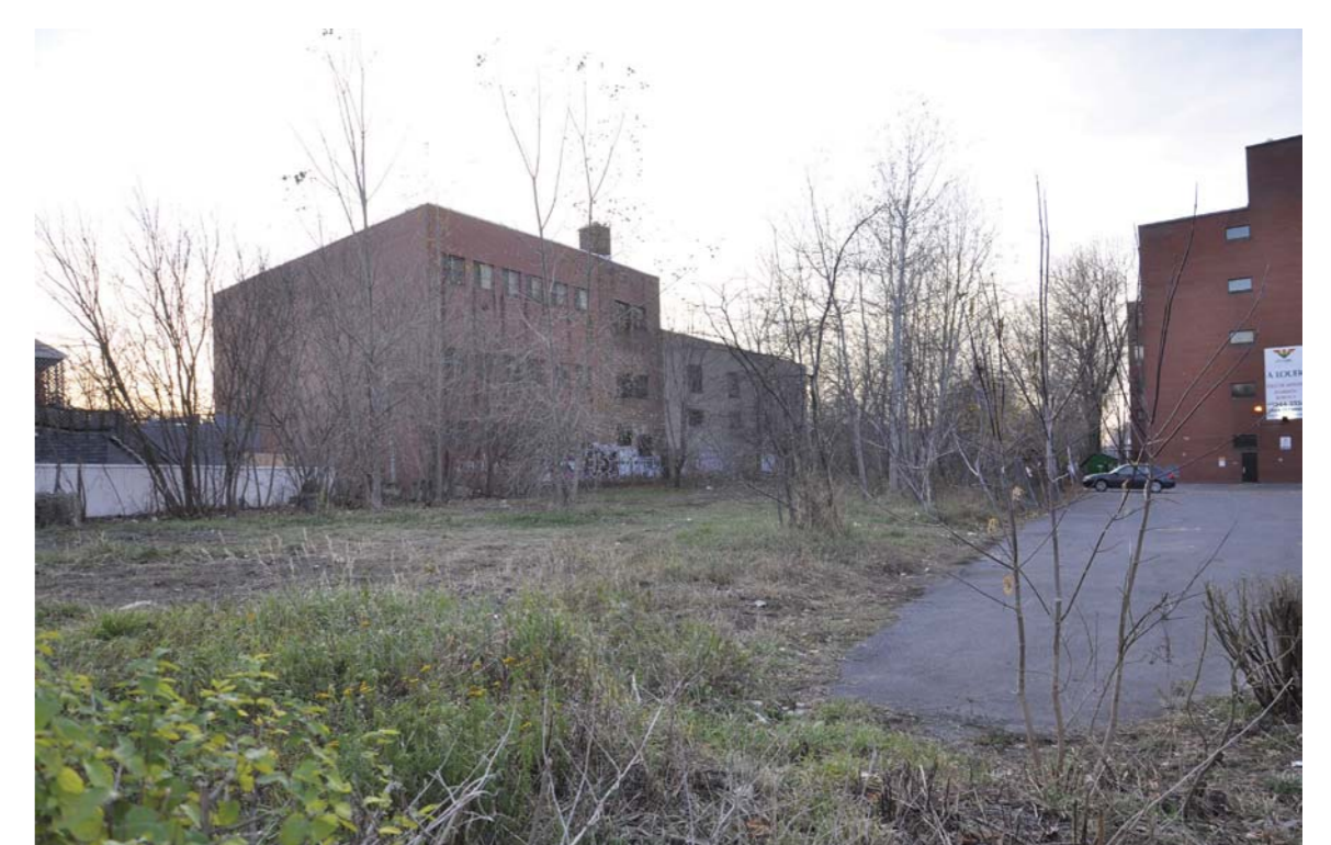
Plusieurs espaces vacants pourraient être transformés