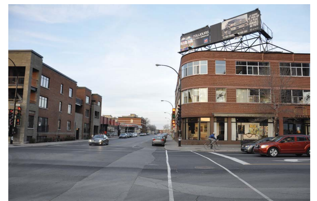
L'espace public est conçu en fonction de l'automobile