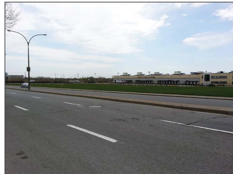
Le caractère « autoroutier » du boulevard, le manque de végétation et la présence de vastes terrains vagues créent un environnement hostile.