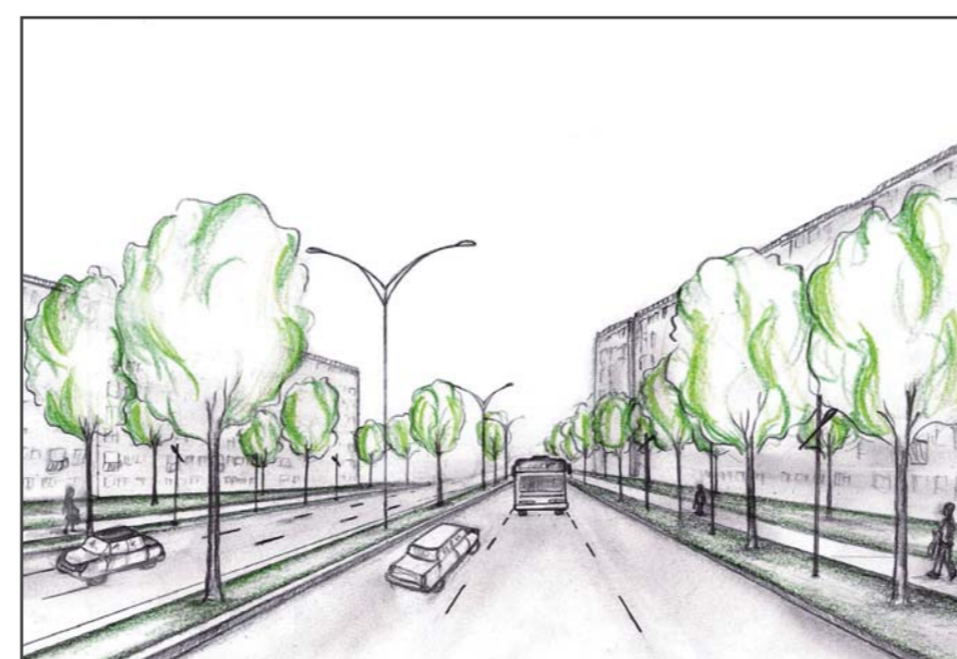
L'aménagement du boulevard de l'Assomption en boulevard urbain permettrait de concilier la vie locale et la circulation automobile, tout en assurant son rôle de desserte.