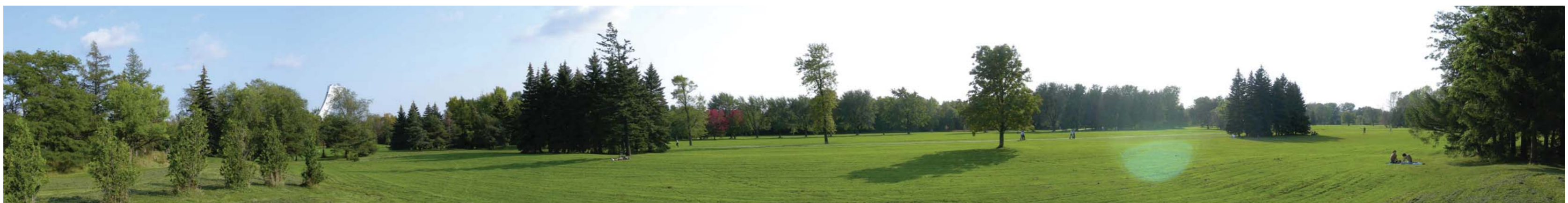
Parc Maisonneuve