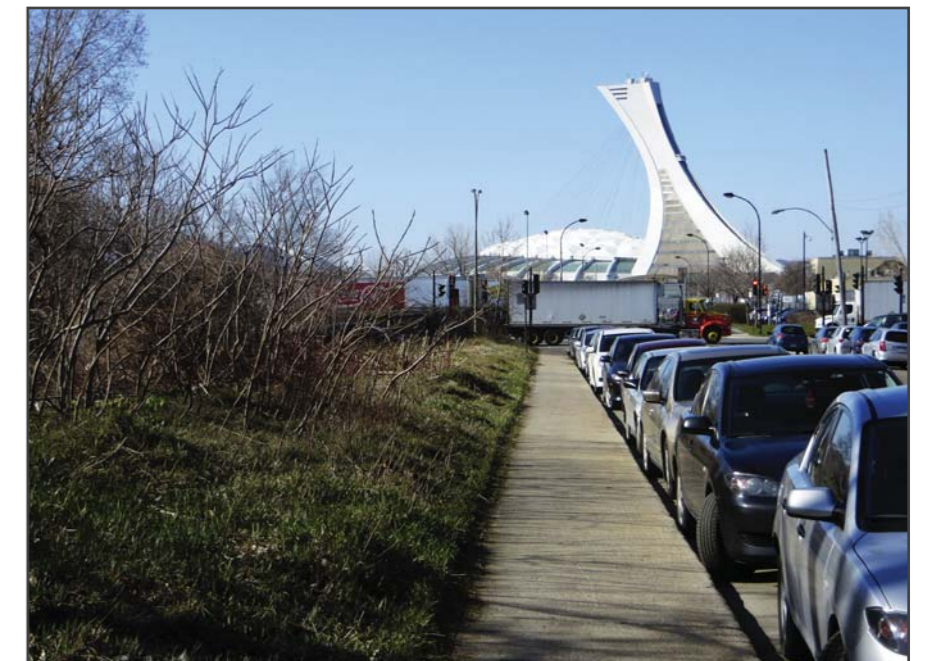
Le secteur l'Assomption, côtoyant le Parc olympique, tire de cette proximité des vues prenantes, entre autres, sur le stade.

Le secteur industriel de l'Assomption est l'un des quatre secteurs d'emploi de l'arrondissement. Cependant, ce dernier s'est transformé, dans les dernières années, accueillant davantage d'entreprises de services autour de la station de métro Assomption. En effet, le départ de plusieurs industries lourdes laisse place à une transformation du secteur. Ainsi, voici la situation actuelle :