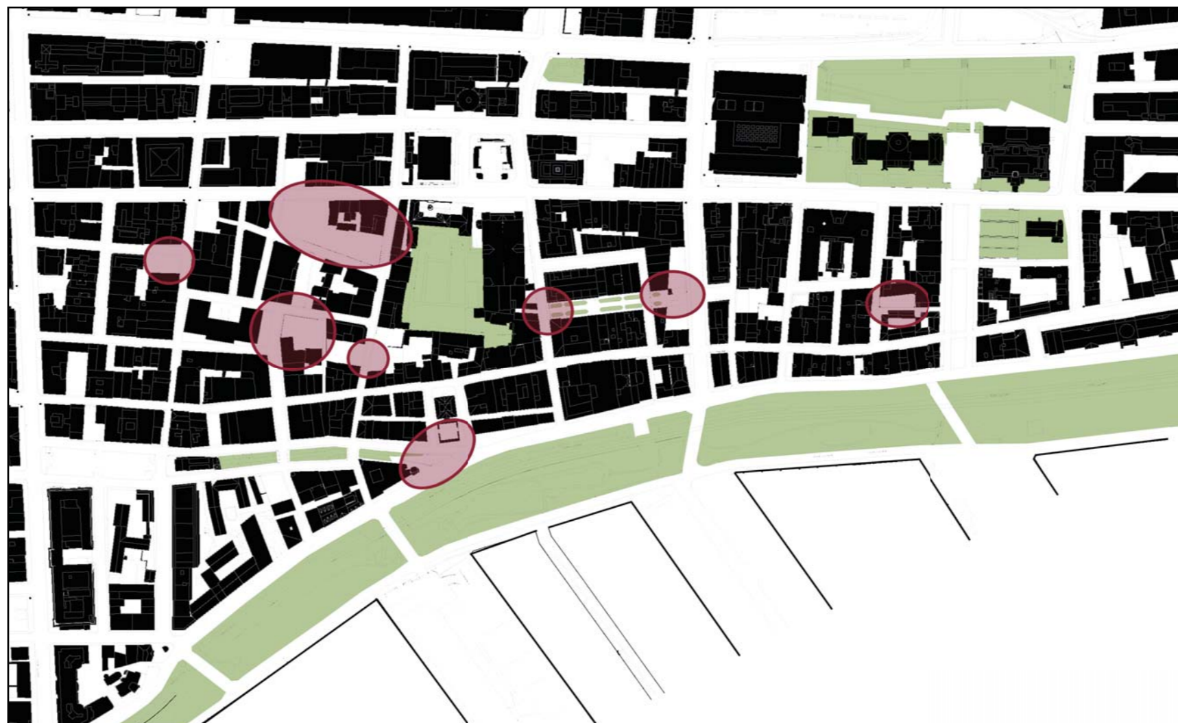
Identification des lieux de rupture

Jan Gehl affirme qu'il existe un lien entre la qualité de ces espaces publics et les activités qu'on y retrouve. Un espace de qualité encourage les citoyens à s'approprier ce lieu. Ce sont ces activités et interactions qui donnent richesse à la vie urbaine. Étant aujourd'hui conçus de manière ponctuelle, le réaménagement de ces espaces se limite à l'encadrement d'une place ou à un segment de rue. Donc, l'espace public devient fragmenté et l'expérience piétonne est fortement affectée. Le piéton ressent ces éclatements dans la structure. Ce sont ces lieux de ruptures qui rendent l'espace illisible et l'expérience piétonne décousue.