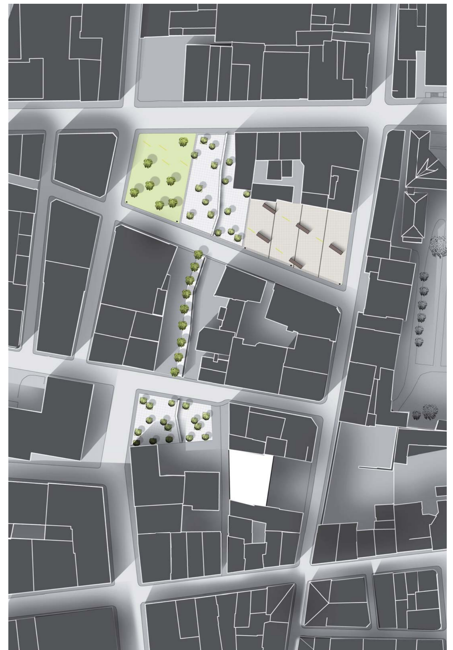
Plan d'intervention