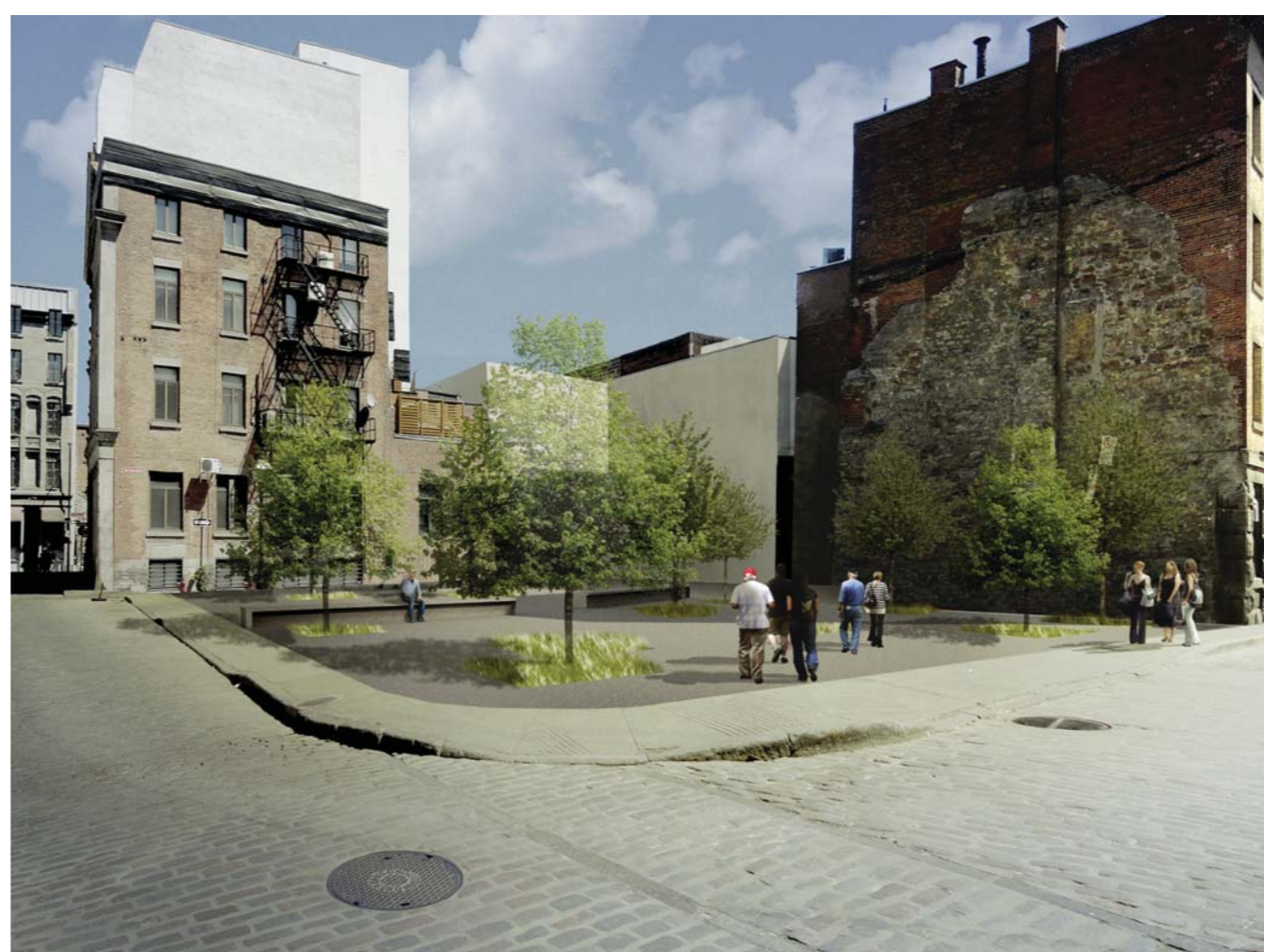
Proposition d'aménagement