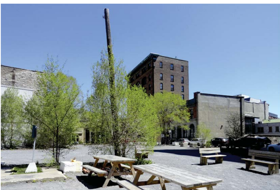
Friche - Notre-Dame

Le recensement des lieux de ruptures a permis de déceler deux catégories d'espaces problématiques: les friches et les stationnements. Chacun de ces espaces offre des possibilités différentes d'aménagement afin d'assurer le continuum dans l'espace public.