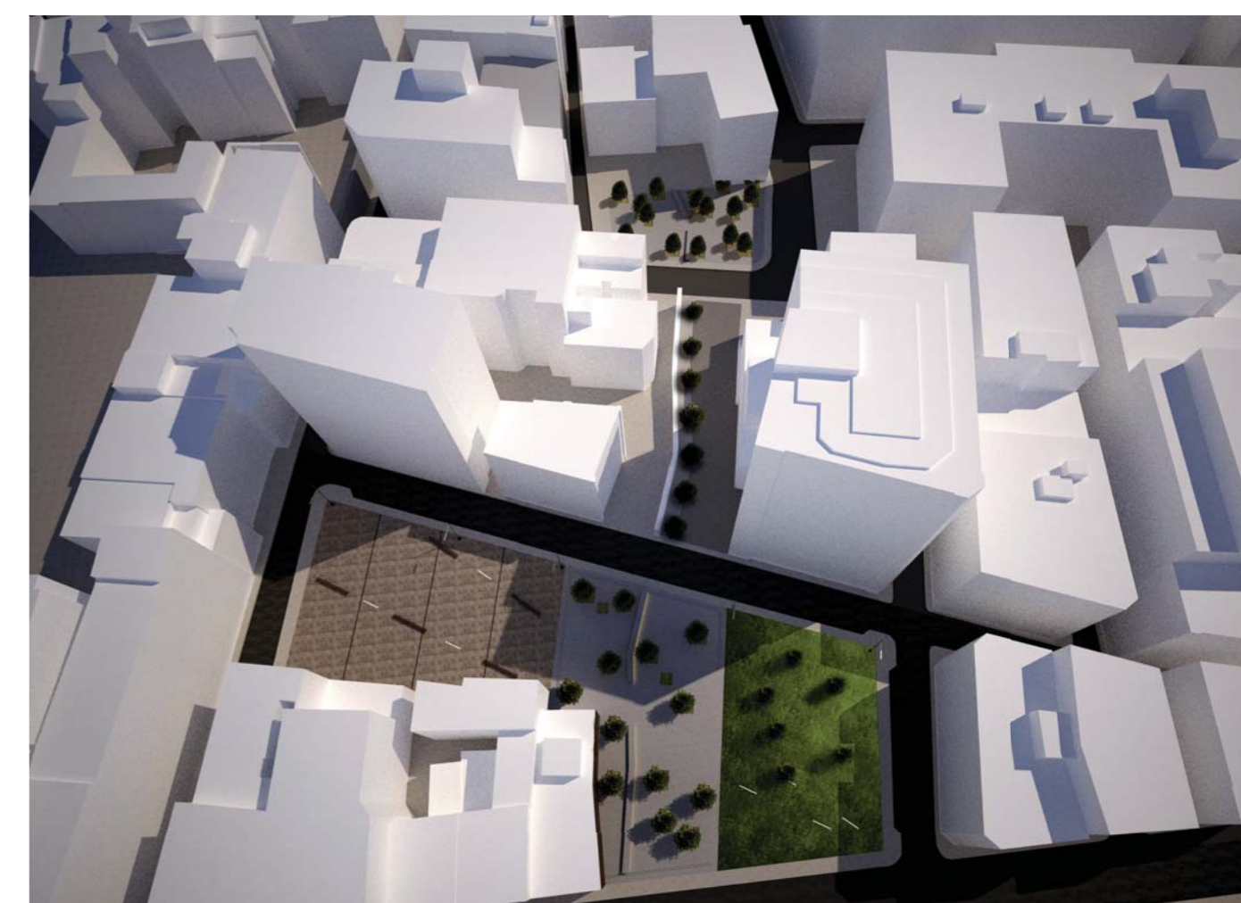
Modélisation du site d'intervention