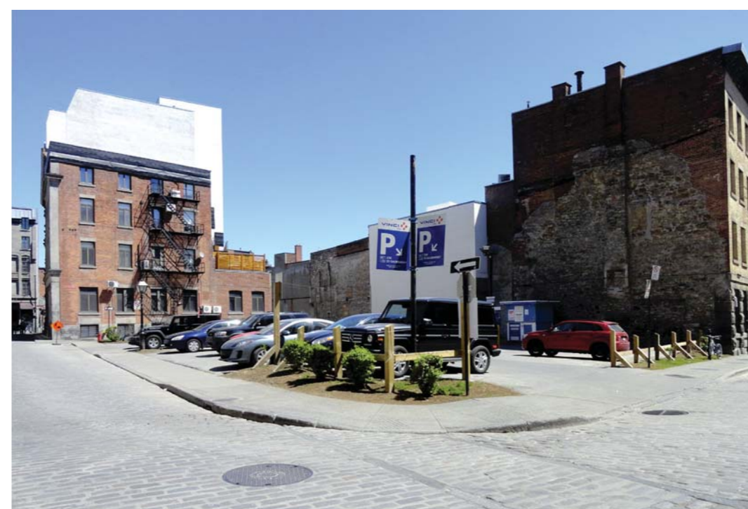
Stationnement public - Saint-Nicolas

Le concept est simple: assurer un espace défini tout le long d'un parcours piéton. Les grands espaces vides sont subdivisés afin de s'inspirer des formes existantes du quartier. Ainsi, on rappelle parfois l'encadrement fort des rues étroites, ou les joyaux verts des cours intérieurs et même les espaces ouverts structurés des grandes places.