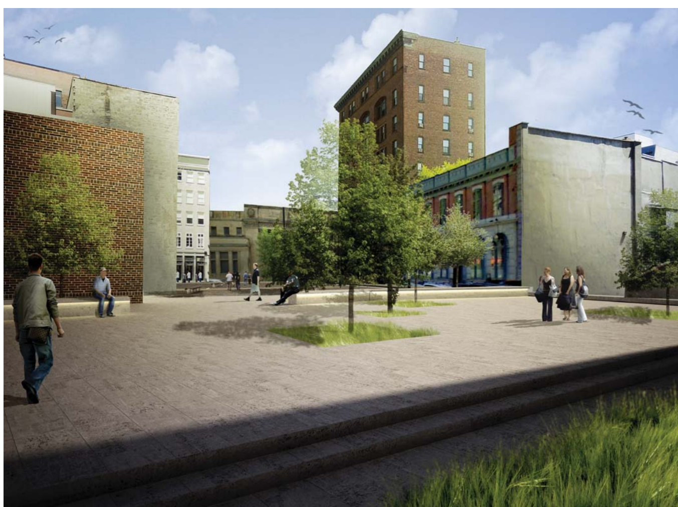
Proposition d'aménagement

Le but n'est pas de créer quelque chose de monotone et répétitif mais bien de s'assurer que le piéton soit toujours dans un espace de qualité.