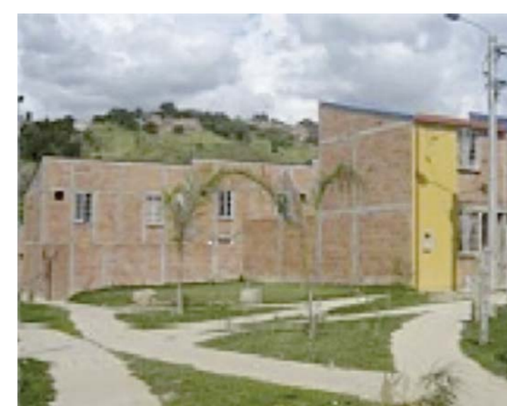
Parc linéaire