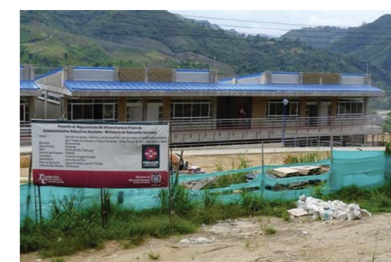
Ecole 2008