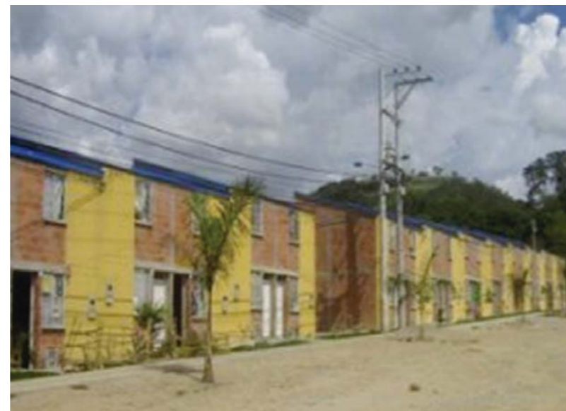
Quartier San Ignacio 2008

En 2008, les deux premières phases ont été construites afin d'accueillir les familles victimes de pluies diluviennes de l'année 2005 et 2007. Cette première partie du projet est constituée de 202 maisons de 35.5 m 2 chacune à deux étages avec salon-salle à manger, cuisine, salle de lavage, une chambre à coucher et une salle de bain. Une apparente commodité qui ne suffit pas aux besoins de ménages composés par 5 personnes à villas de San Ignacio.