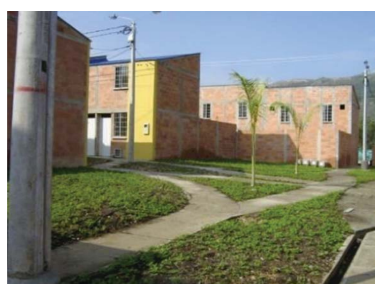
Aménagement de voies piétonnes