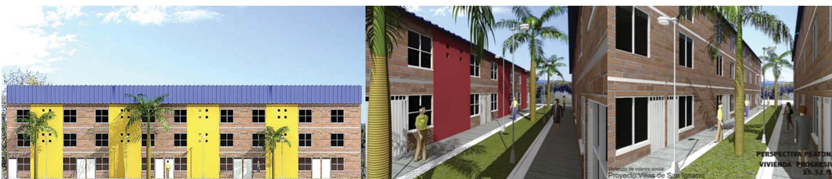
Plan phase 3

Également, ce projet a été développé proche des autoroutes sans pour autant considérer l'importance de construire de ponts piétons pour que les résidents du quartier puissent se déplacer en totale sécurité. Trois ans après sa construction, les logements bâtis et l'école du quartier San Ignacio ont présenté des problèmes de détérioration et d'infrastructure. De ces faits, les résidents ont développé un sentiment d'insatisfaction concernant les conditions inadéquates d'habitat et de la qualité du logement (taille, construction et services de base.)