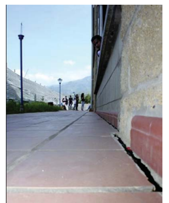
Fissure dans le mur 2009