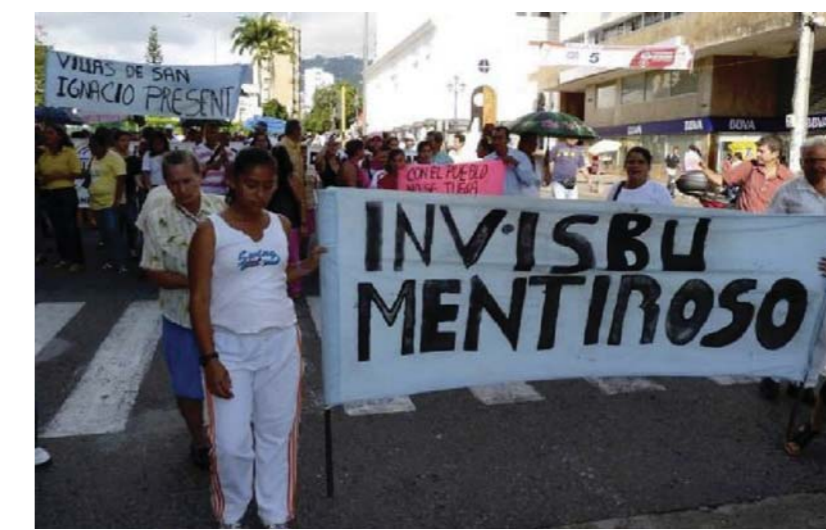
Manifestation de résidents 2010

Également, ce projet a été développé proche des autoroutes sans pour autant considérer l'importance de construire de ponts piétons pour que les résidents du quartier puissent se déplacer en totale sécurité. Trois ans après sa construction, les logements bâtis et l'école du quartier San Ignacio ont présenté des problèmes de détérioration et d'infrastructure. De ces faits, les résidents ont développé un sentiment d'insatisfaction concernant les conditions inadéquates d'habitat et de la qualité du logement (taille, construction et services de base.)