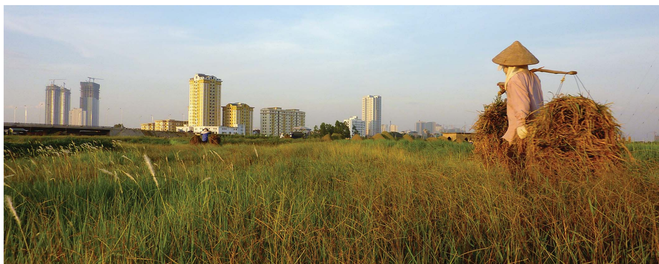
Fragmentation territoriale et métamorphose des milieux ruraux vietnamiens.

Les métropoles asiatiques connaissent actuellement de profondes métamorphoses associées à leur forte croissance démographique et économique. Depuis quelques années, cette croissance accélérée affecte non seulement le territoire, mais modifie aussi le mode de vie des populations urbaines et rurales. Les Nouvelles Zones Urbaines (NZU) sont l'un de ces facteurs de changements. Ces grands ensembles principalement résidentiels, construits en périphérie des grands centres urbains, engendrent des problèmes environnementaux et socio-économiques, ressentis à différentes échelles.