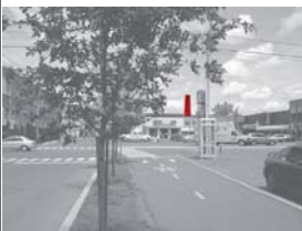
L'ancienne cheminée pourrait devenir un point de repère important pour le secteur en détruisant l'un des bâtiments commerciaux du site.