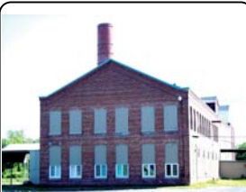
Plusieurs bâtiments industriels seront conservés, notamment celui classé au patrimoine historique.