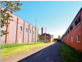
Il faut conserver et mettre en valeur ce qui fait la spécificité de la Drummondville: son passé historique.