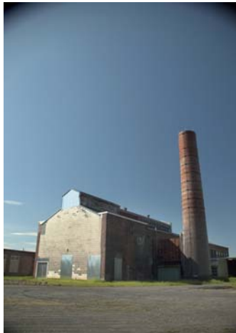
Cette ancienne chaufferie est classée historique par la ville. La cheminée peut même devenir un point de repère dans le secteur.