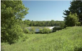
Le site de la Fortissimo est l'un des seuls endroits disponibles situés directement sur les berges de la rivière Saint-François.