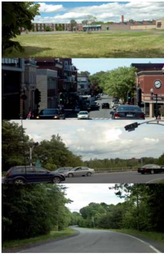
Le parcours à partir de la sortie de l'autoroute au site de la Fortissimo. On note une succession de paysage et une transition difficile à l'intersection de Saint-Georges et Montplaisir.

MAGGY desgagnés, MOLIE lamonde-cantin, MANON lamontagne, MAXIME turcotte-noisieux