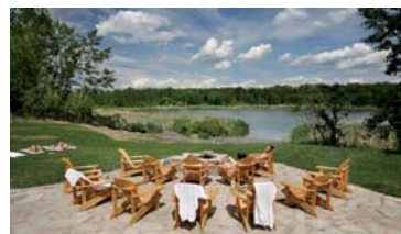
Type d'ambiance recherchée sur le site. Elle devra garder l'essence de la détente et mettre à profit le paysage et les sites patrimoniaux présents.

Ce parcours pourrait s'étendre à une autre échelle : il y a possibilité de le raccorder à la route des Cantons de l'Est, pour lui accorder une zone d'influence plus régionale, et, à l'échelle de la ville, de le prolonger jusqu'au parc Sainte-Thérèse ce qui lui permettrait d'offrir des activités nautiques sur les eaux calmes de la rivière entre les deux barrages.