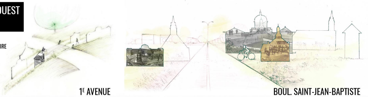
1 È AVENUE

PANNEAUX VITRÉS ILLUSTRANT L'HISTOIRE DU QUARTIER